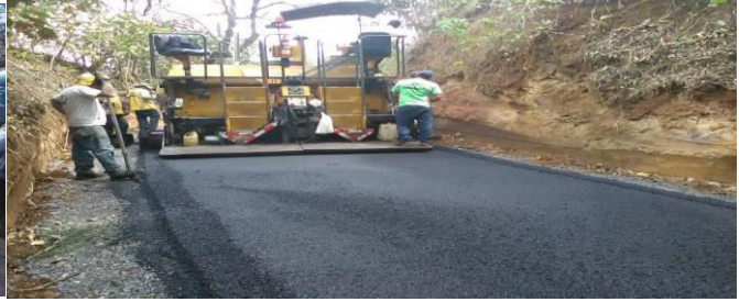
• CALLE CONCEPCION 2-04-011, PROYECTO: ASFALTADO Total Proyecto: Q13.728.105,44