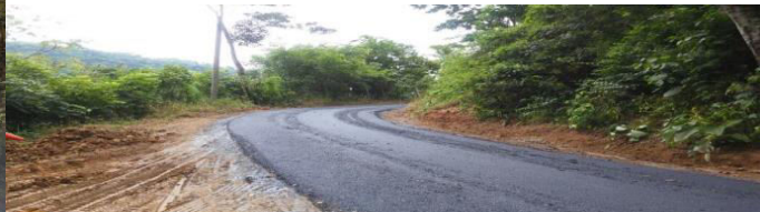
CALLE CERRO CHOMPIPE 2-04-012, PROYECTO: ASFALTADO