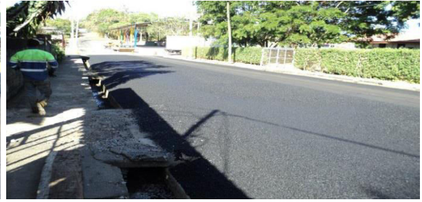
PROYECTO: COLOCACION DE TUBERIA DE 90 Y POZOS Total Proyecto: ₡48.823.233,80