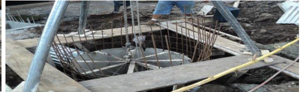
PROYECTO: CORDON DE CAÑO Y ASFALTADO COSTADO AL GIMNASIO Total Proyecto: ₡18.486.984,12