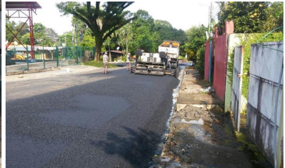
PROYECTO: CONSTRUCCION DE MURO Y CABEZALES Total Proyecto: ₡1.656.298,52