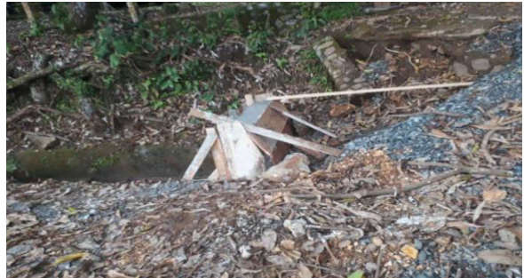
PROYECTO: CONSTRUCCION DE CABEZALES Total Proyecto: ₡137.458,64