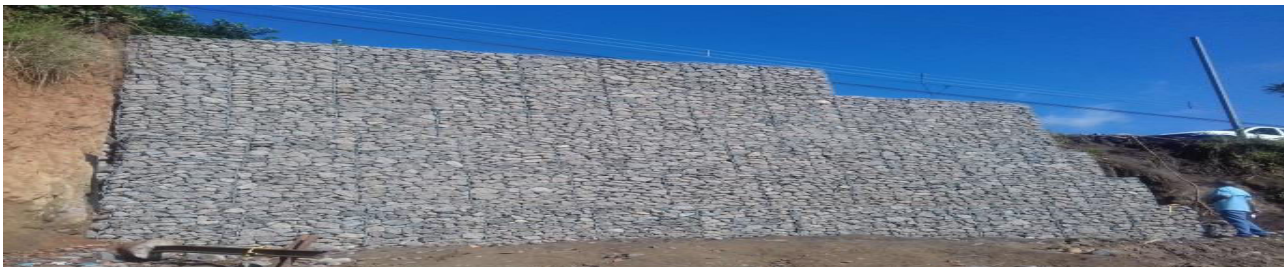
• CALLE LA LIBERTAD 2-04-065, PROYECTO: ASFALTADO DE CUESTAS Total Proyecto: Q27.439.399,13